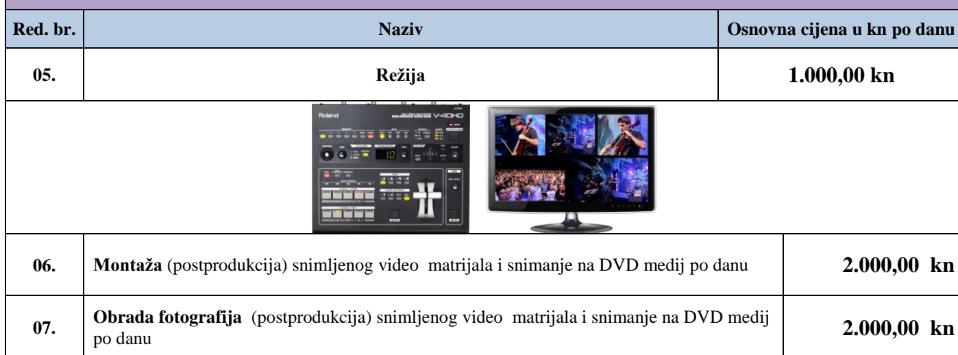
FOTO I VIDEO PRODUKCIJA SLIKE I POSTPRODUKCIJA